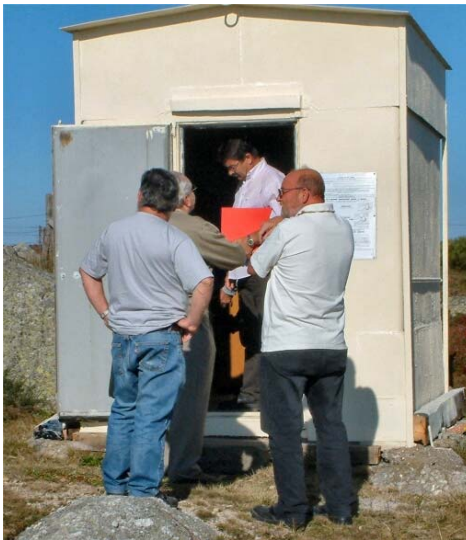
Contrôle de l'ANF au Randon dans l'abri rénové du R4X.